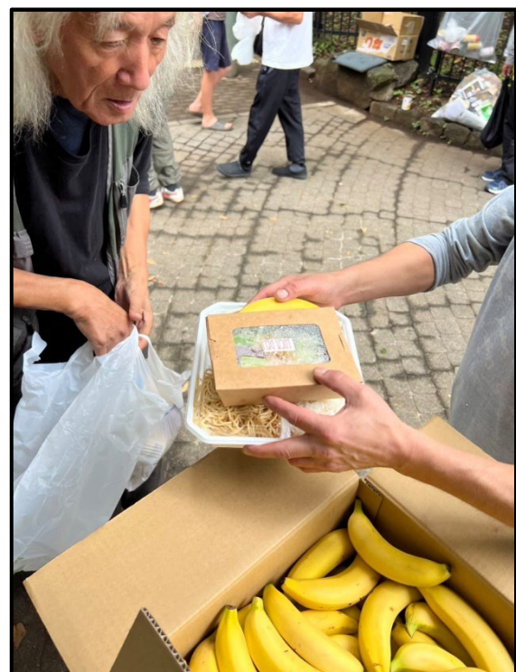
写真2-食料を受け取るホームレスの方々